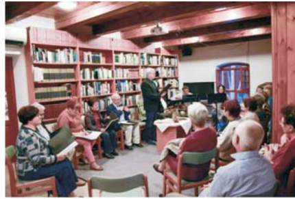
Ladányi Mihály emlékest