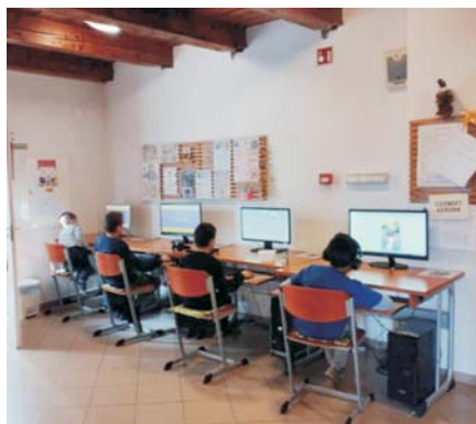
Könyves vasárnap – „Kötelező olvasmányok másként”