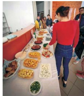
Egészséges étkek kóstolója