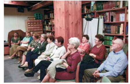
Ladányi Mihály emlékest