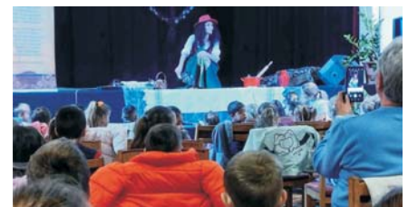
Országos Könyvtári Napok Csernik Szende