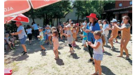
Csongrád – Vadnyugati város