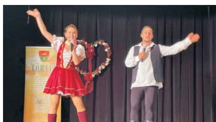
Operett est, Fedák Sári Társulat