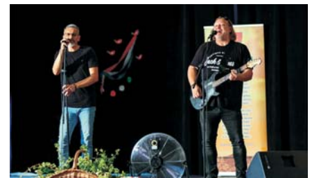
Augusztus 20. – Bon-Bon