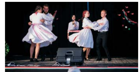
Augusztus 20. – Patkós Irma Művészeti Iskola