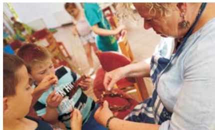
Hagyományőrző tábor – kosárfonás