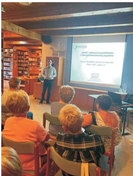
Előadás a könyvtárban