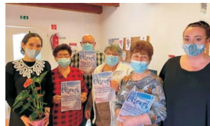
Senior net tanfolyam