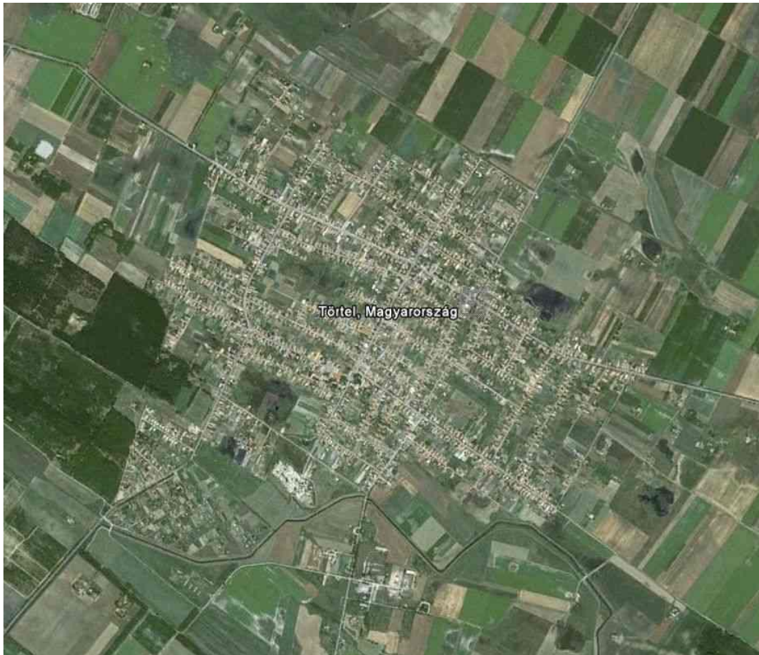
Törtel község jelenlegi szerkezete