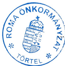
Törtel Roma Nemzetiségi Önkormányzat elnöke