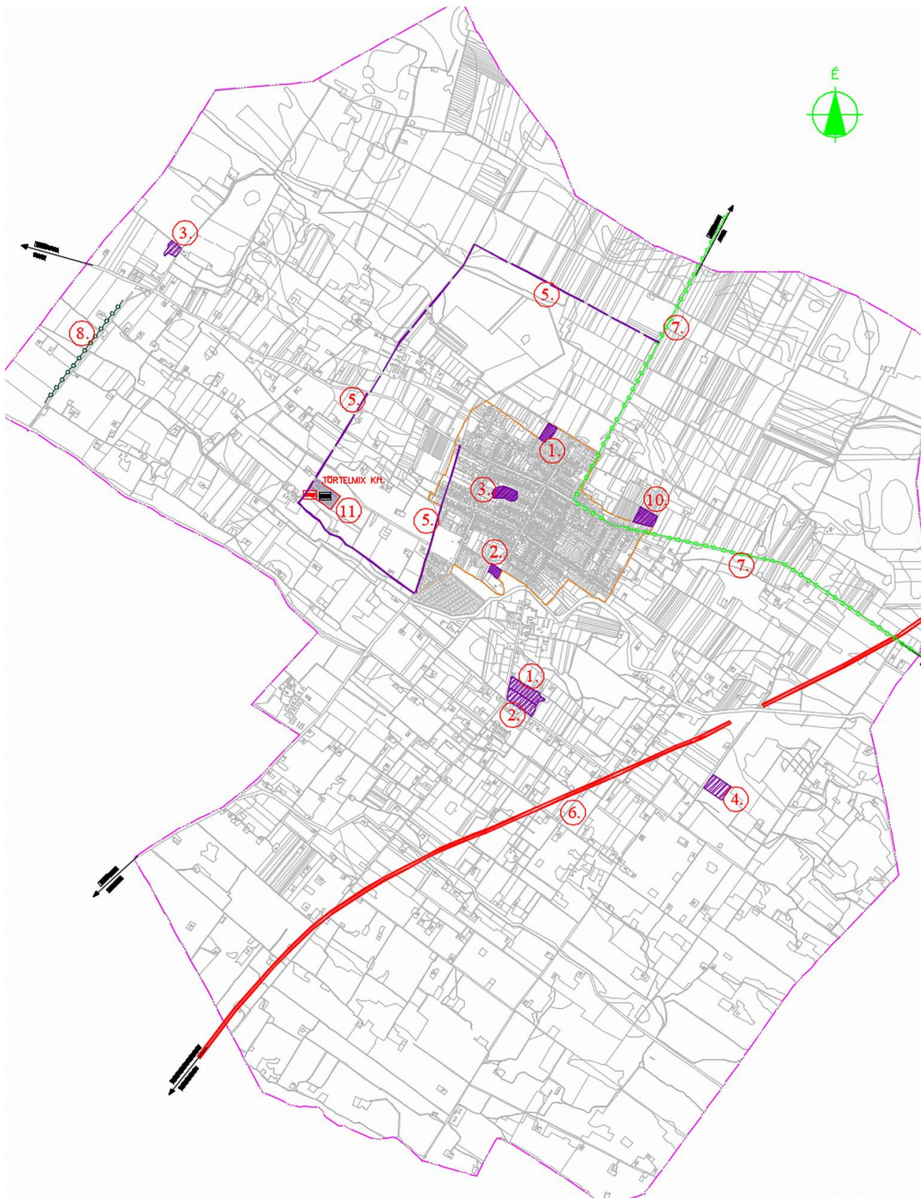
Fejlesztési területek elhelyezkedése Törtelemix Kft. közigazgatási területén